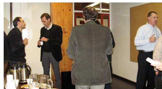
Break “Emprendedores en Red”